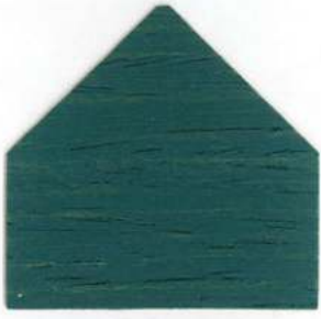
8715 Blu chiaro - Hellblau Bleu clair