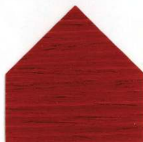
7809 Mogano - Mahagoni - Acajou