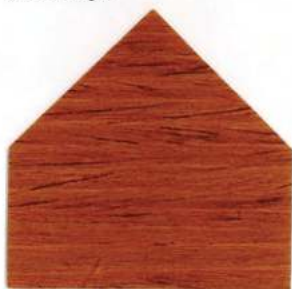
7804 Teak Birmano - Burma Teak Teck Birman