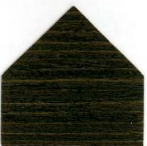
8720 Spruce green