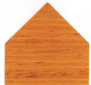
7803 Oregon Pine Pin de l'Oregon