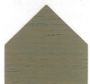
2076 Gallegiante - Treibholz Bois de dérive