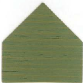
525 Verde sale - Salzgrün Vert sel