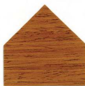
7805 Rovere - Eiche - Chêne