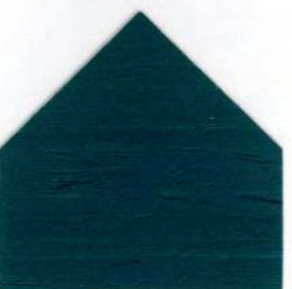
8805 Blu cicladi - Blau Cyclades Bleu cyclades