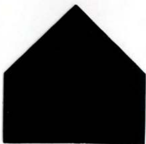
8893 Ebano - Ebenholz - Ébène