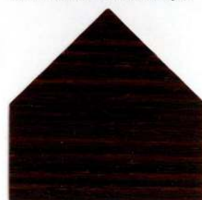
7810 Palissandro - Palisander Palissandre