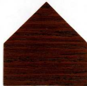
7808 Noce - Nuss - Noyer