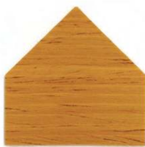
7801 Rovere chiaro - Eiche Hell Chêne clair