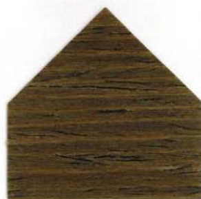
Effetto antico 1 - Antik Effekt 1 Effet antique 1