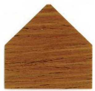
7806 Castagno - Kastanie Châtaignier