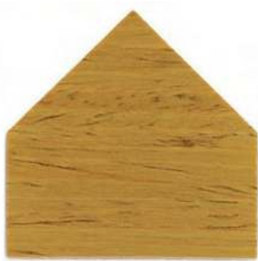
7816 Rovere naturale - Eiche Natur Chêne naturel