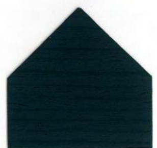
4170 Antico - Antik - Antique