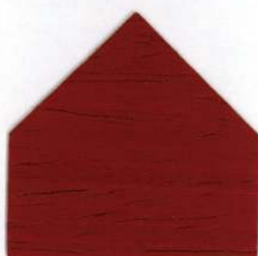
8709 Rosso royale - Royal Rot Rouge royal