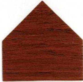
7813 Noce medio - Nuss Mittel Chêne moyen