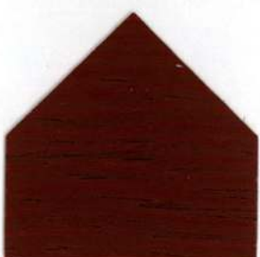
8504 Rosso svedese Schwedenrot - Rouge suédois