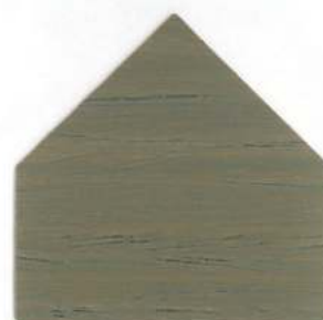
Effetto antico 2 - Antik Effekt 2 Effet antique 2