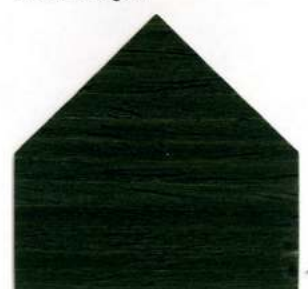
5510 Verde abete - Tannengrün Vert sapin