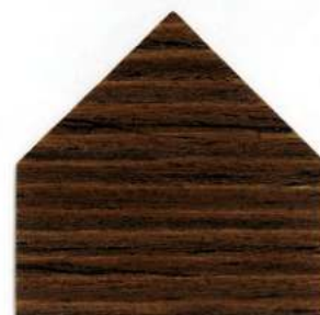
7814 Rovere rustico Eiche Rustikal - Chêne rustique