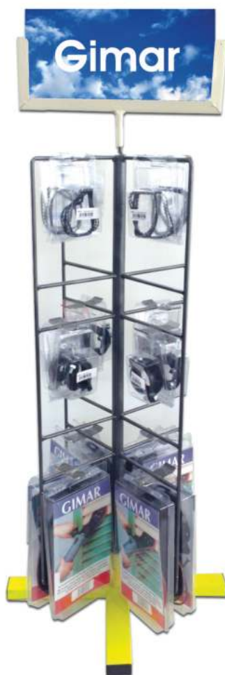
99220 Espositore GIMAR